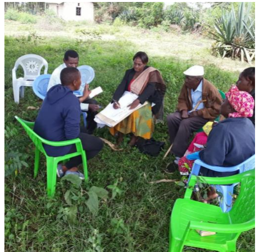
Kikundi cha soko la Pamoja la SUCA wakifanyia kazi zoezi la utafutaji masoko.