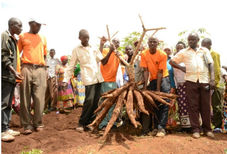
Washiriki wa mradi wa AEBR wakionesha ongezeko kubwa la mavuno ya mhogo kwa mtaalamu wa kilimo wa sekta wakati wa siku ya matembezi ya shambani huko Gahara-Kihere.

Kulingana na uzoefu na mafunzo kutoka katika mradi huko Kirehe, AEBR pamoja na CBM / CFGB, wanapanga kuanza mradi kama huo wa usalama wa chakula mwaka huu ukilenga kaya 1,200 katika jamii nne ndani ya Wilaya ya Ngoma. Mbali na kujenga uwezo wa wakulima katika kilimo endelevu zaidi, mradi pia unakusudia kujenga ushirikiano wa kushawishi sera / utetezi kama mwelekeo mpya wa kupanua ufahamu, msaada na kupitishwa kwa kilimo endelevu zaidi ya upeo wa mradi wa kijiografia kwa Rwanda kwa ujumla.