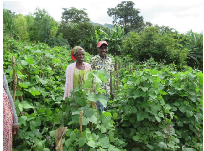
Kwa kuchanganya kanuni za kilimo hifadhi na usimamizi bora wa rutuba ya udongo, ikiwa ni Pamoja na mbolea ya shambani na mazao ya kufunika shamba; shonga shona ya Zala, Ethiopia iliongeza mavuno yao ya mahindi kwa 29% katika mwaka wa kwanza, huku ikijenga afya ya udongo ya muda mrefu.

Mbinu zingine nzuri za ziada za kilimo zinazohamasishwa na mradi husika zinatofautiana katika mandhari tofauti za kilimo. Kutambua njia ipi ya kuhamasisha lazima kuhusisha tafiti za wakulima na mahojiano katika jamii ili kugundua ni njia ipi itatoa Mavuno au ubora wa chakula makubwa kwa muda mfupi, hivyo kuwasaidia wakulima kulisha familia zao huku wakisubiri manufaa ya muda mrefu ya kilimo hifadhi yatakayoonekana baada ya muda.