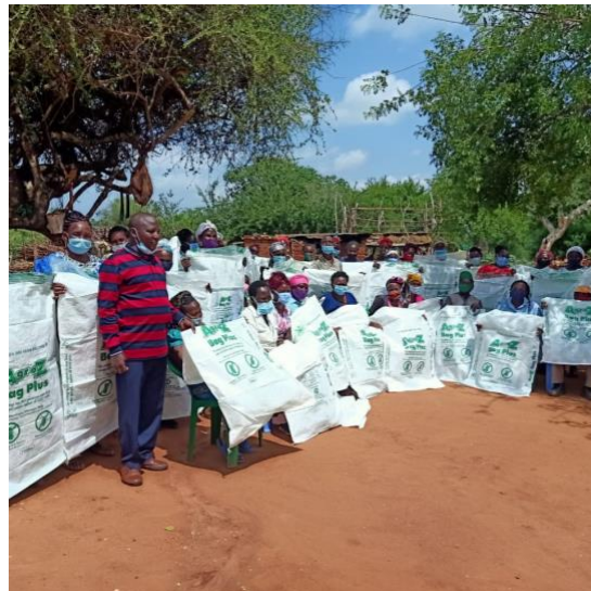
Mifuko ya PICS, au teknolojia ya uhifadhi isiyoruhusu hewa kupita, inarushusu wakulima kuuza mazo yao pale ambapo bei imeongezeka

Video ambazo zinaelezea njia iliyo hapo juu zinapatikana katika: https://foodgrainsbank.ca/ca-videos . Timu ya ALTA inafanya mabadiliko kwenye mwongozo ulioasisiwa wa mafunzo ya mkulima kwa uuzaji wa pamoja. Wasiliana nasi ikiwa una nia ya nakala.