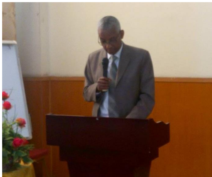
Katika mwaka 2018, baada ya kuona matokeo ya Kilimo hifadhi zaidi katika miradi ya washiriki wa CFGB, Waziri wa kilimo Ethiopia alitangaza kuwa Kilimo hifadhi kitahamasishwa na mifumo ya wagani katika mikoa mitano nchini.

kisha kuongeza shughuli zingine pale ambapo harakati za kilimo hifadhi zaidi, ongezeko hili, kwa mfumo uliopangiliwa unapelekea mafanikio makubwa ndani ya eneo kubwa kwenye mazingira wezeshi. Mafanikio ya utetaji wetu mkubwa wa kilimo hifadhi, kwa mfano, yametokea pale ambapo tumewapeleka watumishi wa serikali na wasomi kutembelea jamii ambazo zilikuwa na shauku kubwa katika kufanya kilimo hifadhi zaidi na wakaweza kuongeza usalama wa chakula. Juhudi za kibiashara zinafaulu zaidi endapo wakulima wameongeza uzalishaji kiasi cha kutosha kufikia uhitaji katika usalama wa chakula na sasa wanaziada ya kuuza. Wasambazaji wa pembejeo wanavutiwa sana na jamii ambazo wakulima wana bidii na wana namna za kununua bidhaa za nje. Mahitaji ya mifugo yanapatikana kiurahisi pale ambapo usalama wa chakula cha binadamu imefanikiwa, na malighafi zaidi zinaweza kuzalishwa kwa ajili ya kulisha Wanyama. Hivyo, wakati shughuli ambazo zinapelekea mazingira wezeshi zinasaidia katika mapokeo ya kilimo hifadhi zaidi, vilevile wanafaidi matokeo chanya yatokanayo na uzalishaji na uendeleu wa jamii ya kilimo.