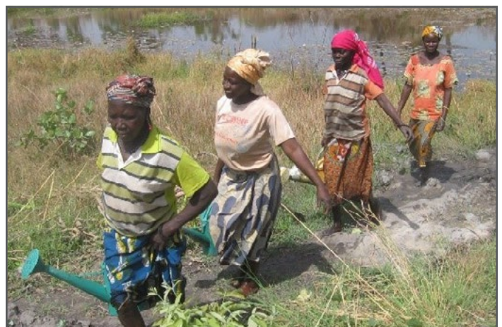
Wanawake walima bustani wakiteka maji kwa ajili ya kumwagilia mboga zao.