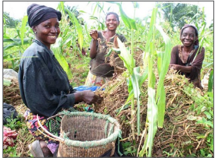
walengwa wanawake wa CFGB / MCC wanaofadhili mradi Oasis i kuvuna maharage katika Fizi, DR Congo

Chad ni nchi kubwa mno ambayo ni nusu jangwa\ nchi kavu na yenye joto. Mvua nyingi zinaanza June, zinapungua mwezi wa saba na wa nane na zinazidi kupungua mpaka mwezi wa tisa, zinaacha kipindi kirefu cha ukame kuanzia mwezi wa kumi hadi wa tano. Kilimo kimezidi kua chanzo kikuu cha maisha kwa jamii, na wanawake wanahusishwa kwenye shughuli ya kuzalisha. Mashamba yanamilikiwa na familia yakiwemo ya chakula cha nyumbani kama vile uwele, mtama, mahindi, njegere, karanga ufuta, mchele, matunda na mbogamboga, mazao ya