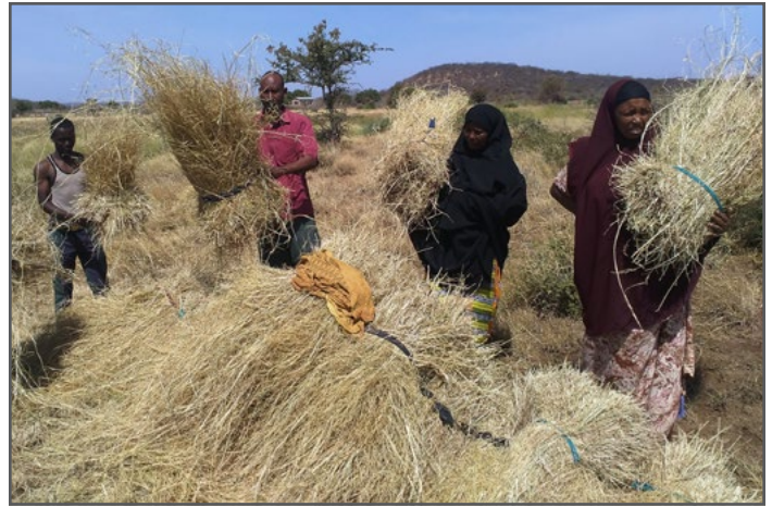
Wakulima wa mradi wa RARE wakivuna majani ya malisho huko Manderu, Kenya.

Katika nchi nyingi, wanawake wa vijijini ni uti wa mgongo wa kilimo kwa ngazi ya chini na kujikimu ya kila siku ya familia. Katika Afrika kusini mwa Sahara ni 15% tu ya wanawake wanaomiliki ardhi (FAO, 2010); wakati wanakaribia 70% ya nguvu kazi ya kilimo barani (Orégand, 2008), pamoja na kufanya kazi bila kulipwa wa kazi za nyumbani, kutunza watoto, nk Hata hivyo, mamlaka na maamuzi ya nguvu kisheria ni mali ya mkuu wa kaya ambaye ni wanaume. Katika maeneo ya vijijini, wanakabiliwa na kuongezeka kwa umaskini na uhamiaji wa wanaume mijini, mzigo wa kazi na majukumu ya wanawake umeongezeka zaidi.